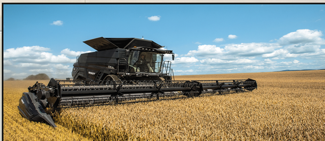
Sort lakeret ramme H: 2000 x B: 5000mm monteret med banner