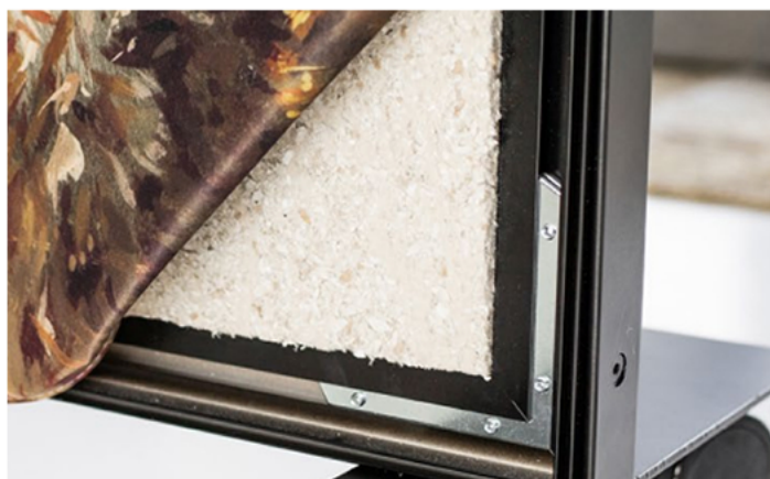
Ramme med støjdemperingsmateriale monteret