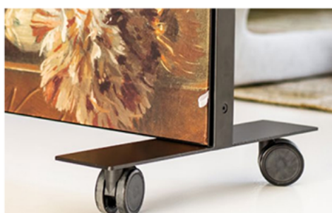
Fodplader med og uden hjul