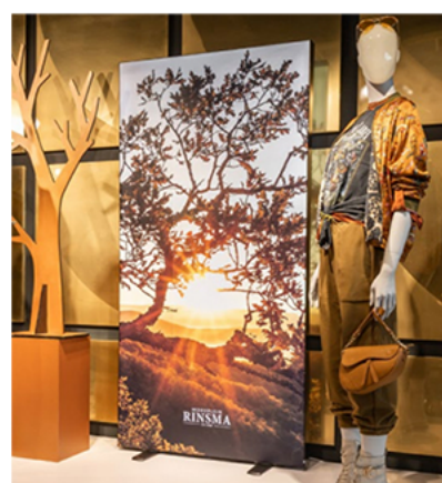
Fritstående dobbeltsidet profil