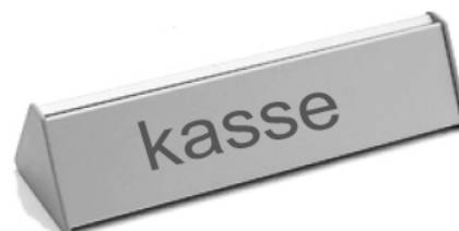
Bordskilt Ag 62x200mm