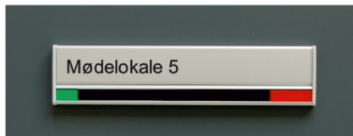
AG 31 + AG 15s m/skydesektion, 200mm, vist i tavle m/45mm grå ender.