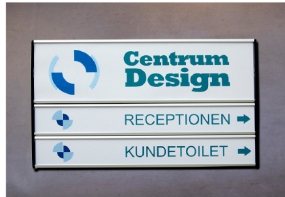
AG 62s + Ag31s med akryl, 210mm., vist i tavle m/125mm sorte ender.