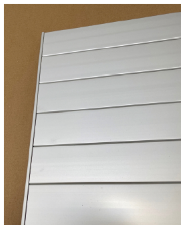
Classic kan opbygges med aluender i tavler