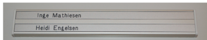
AG 31 med 2 stk. 12mm spor til indstik., natur eloxeret med grå ender